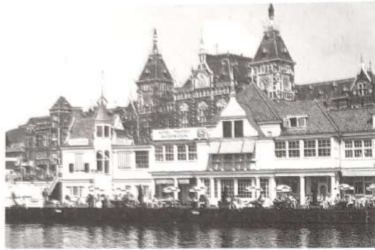
Het Noord-Zuidhollands Koffiehuys/Centraal Station